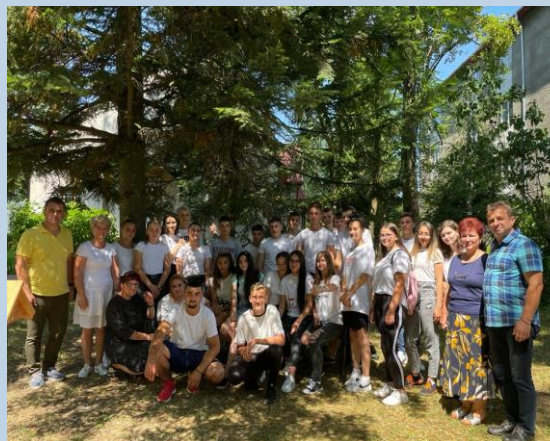
Bistrița - România