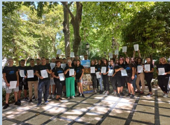
Granada - Spania